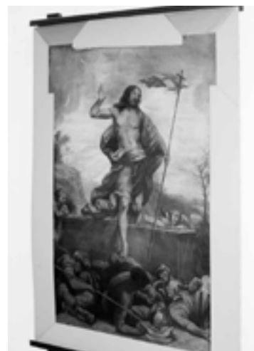
Altarbild; Auferstehung Jesu Christi

Dahlem gehört zu den wenigen alten Dörfern im Gebiet von Großberlin, die sich ihren alten dörflichen Kern, den Dorfanger (Dorfau) in seiner ursprünglichen Gestalt bis heute haben erhalten können: „In der Mitte der Anger, an der Nordseite, auf einer – vielleicht künstlichen – Anhöhe errichtet, die alte Dorfkirche, neben ihr das in das 14. Jahrhundert zurückreichende Herrenhaus und gegenüber der Krug.“, so schreibt Wolfgang H. Fritze in seinem Beitrag „Dahlems Anfänge“ im Ausstellungskatalog „Dahlem St. Annen – Zeiten eines Dorfes und seiner Kirche“, 1989 herausgegeben von der Evangelischen Kirchengemeinde Berlin-Dahlem und der Domäne Dahlem. Landgut und Museum. Gundolf Herz, Pfarrer in St. Annen von 1979 bis 1988, schrieb im gleichen Katalog: „Die Domäne ist eben nicht nur ein interessantes landwirtschaft-