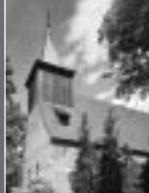
St. Annen - Kirche