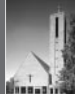
Jesus - Christus - Kirche

Gleichzeitig mit dem Gottesdienst in der St. Annen-Kirche findet – außer während der Schulferien – der Kindergottesdienst statt.